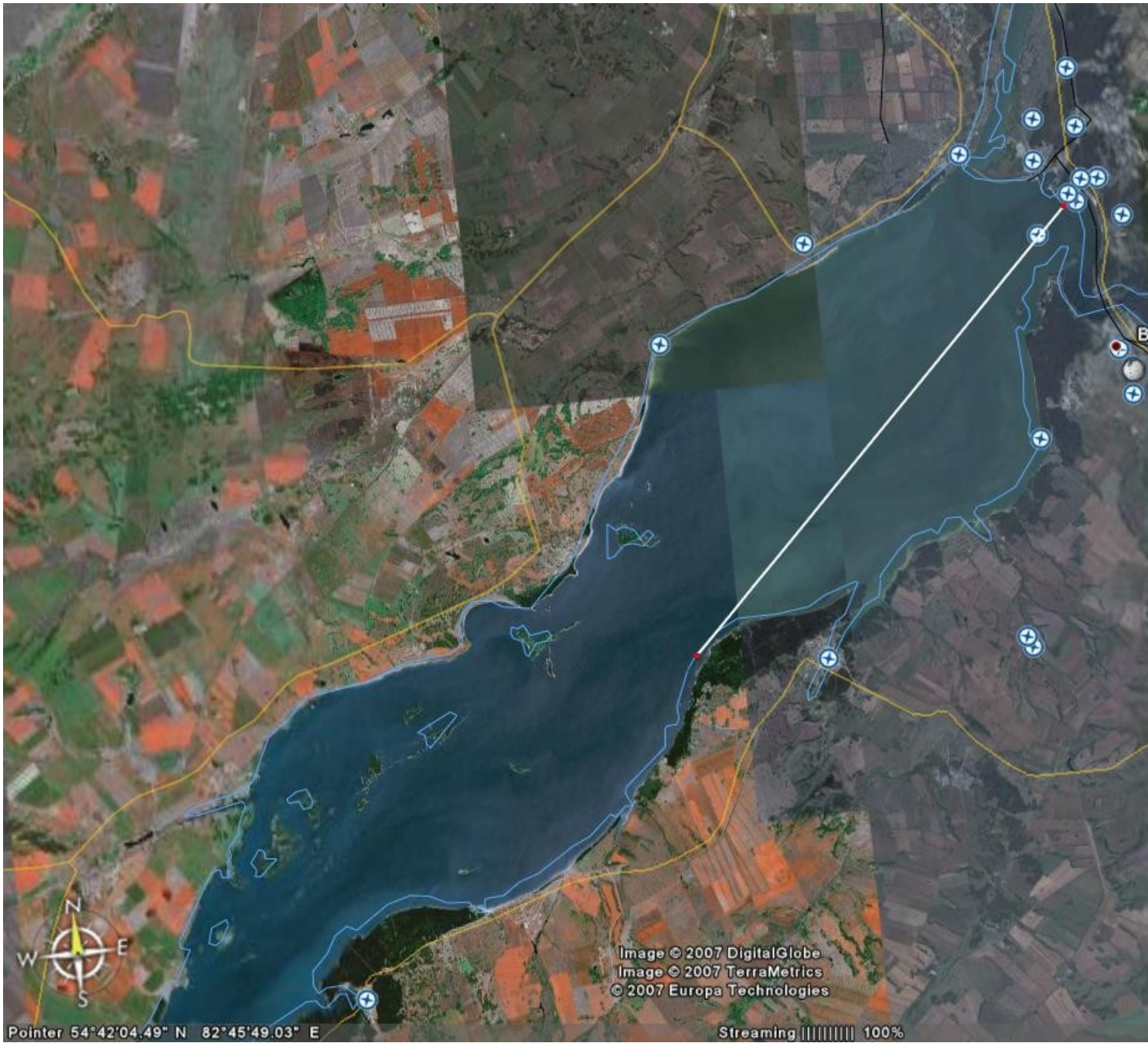
Примерный маршрут. Длина линии – 29.06 км.